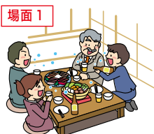
飲食を伴う懇親会など