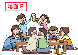
大人数や長時間におよぶ飲食