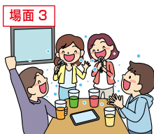
マスクなしでの会話