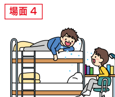
狭い空間での共同生活

新型コロナウイルスワクチン接種はあなた自身のためだけでなく大切な家族や友人を守ることに繋がります。