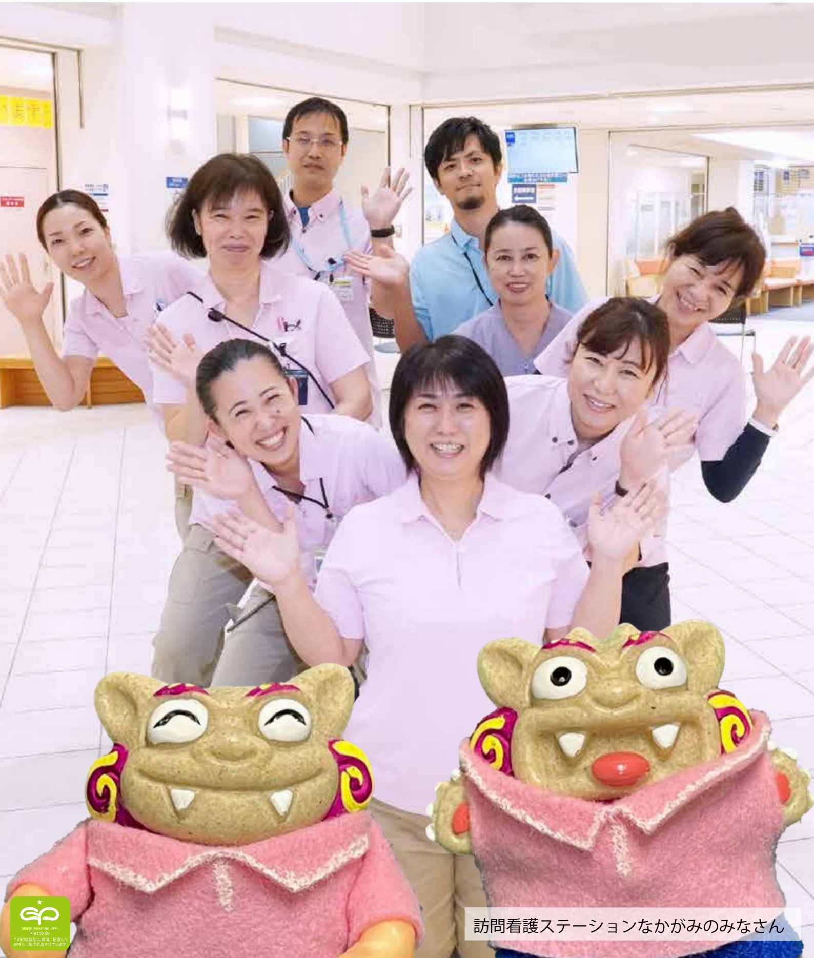
訪問看護ステーションなかがみのみなさん

社会医療法人敬愛会 広報誌 ご自由にお取りください 2021.12 Vol.106号