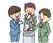
居場所の切り替わり