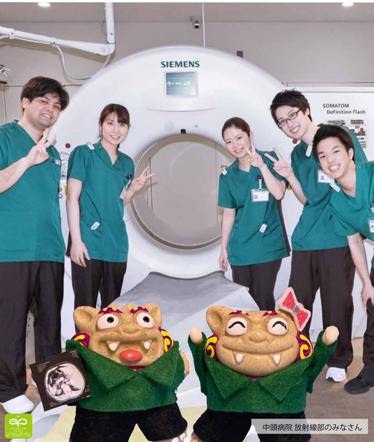
中頭病院 放射線部のみなさん