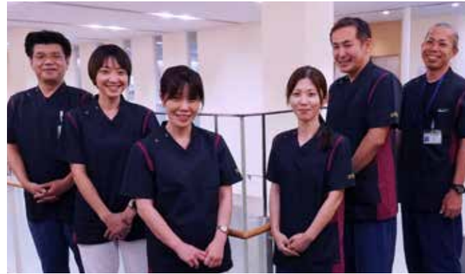
▲ 特定看護師はユニフォームも新しくなりました

2021年4月に開講した看護師特定行為研修(以下、特定行為研修)の全カリキュラムを終え、新たに6名の特定看護師が誕生しました。 今後、5つの特定行為区分での活動が始まります。 よりきめ細かくタイムリーなケアを提供してまいります。