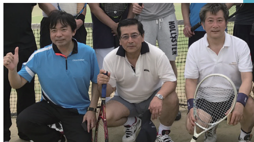
▲ どんなことがあってもテニスはプレーします