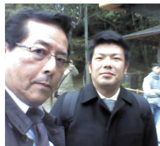
▲ 愛弟子と学会にて

普段のウォーキングに加えて、負荷をかけたオリジナルコースを歩いています。松島(那覇市)からスタート。首里金城町の石畳を抜けて、守礼の門~首里城の外壁をぐるっと回ります。勾配があり足場も不安定で2時間弱かかるかな。だいぶ良い筋トレになっています。あとは学生時代からテニスを続けています。コースを読んで、受けたボールの勢いを利用して打ち返す!全集中でラリーを続けています(笑)