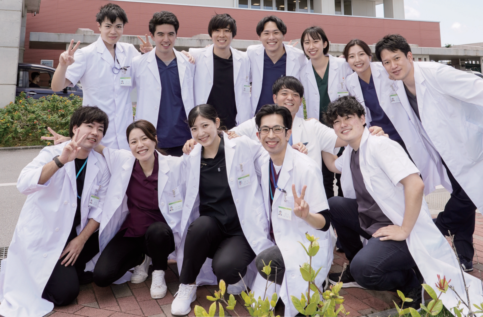
2022年度 中頭病院 初期研修医のみなさん