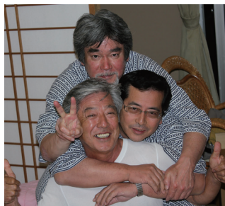
▲ 悪そうで悪くない仲間と