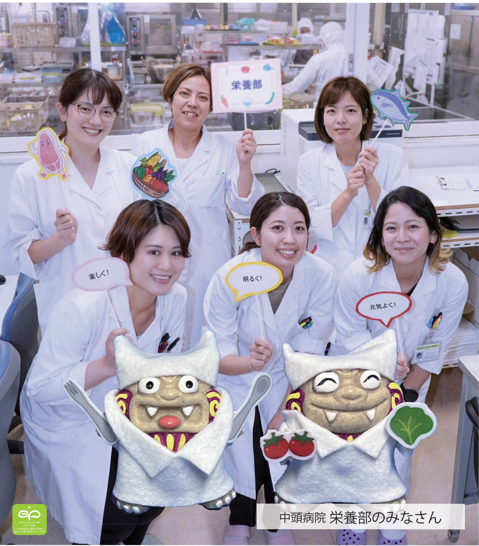
中頭病院 栄養部のみなさん