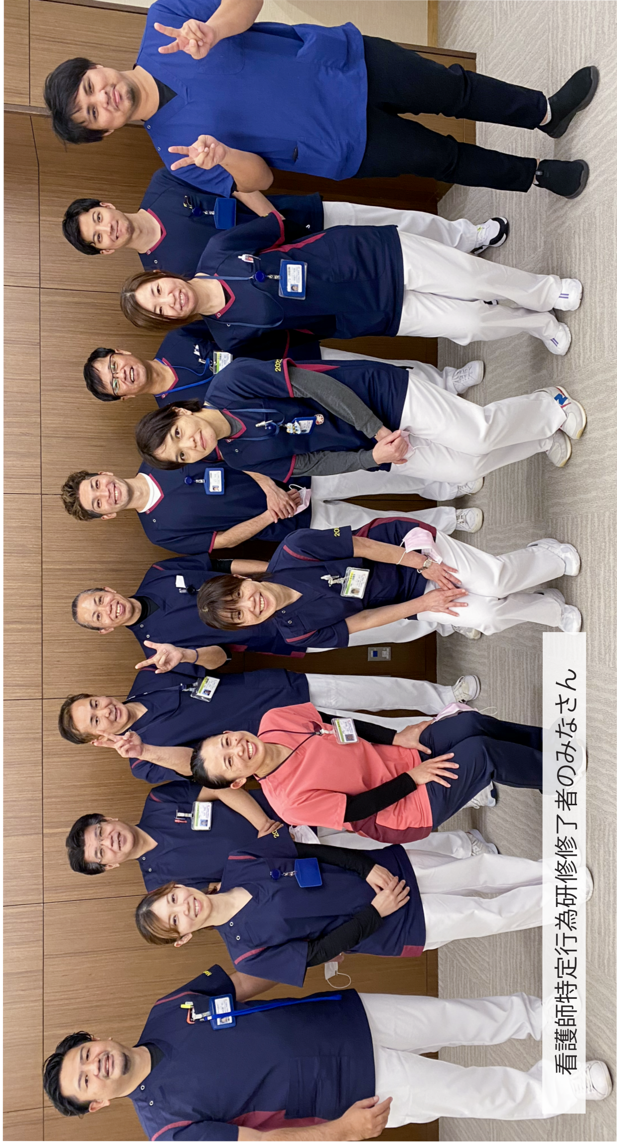
看護師特定行為研修了者のみなさん