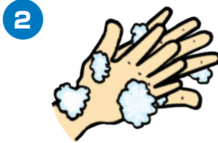
手の甲を伸ばすようにこすります