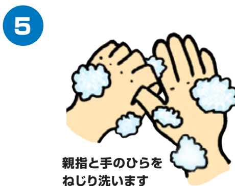
親指と手のひらをねじり洗います