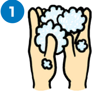
流水でよく手をめらし、石けんをつけ、手のひらをよくこすりつけます