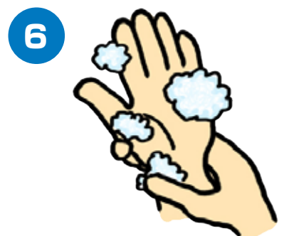
手首も忘れずに洗います

石けんで洗い終わったら、十分に水で流し、清潔なタオルなどでよく拭き取って乾かします