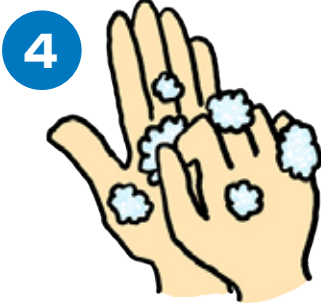
指先・爪のあいだを念入りにこすります