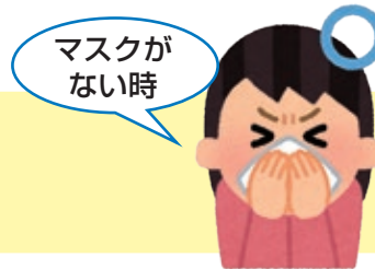
ティッシュ・ハンカチで 口・鼻をおおう