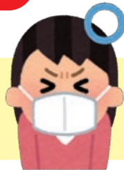
マスクを着用 (口・鼻をおおう)