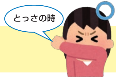
袖で口・鼻をおおう