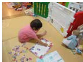
末娘3歳児は見ているだけでおもしろい

大学時代に医学生のバドミントンの大会に出たりしてましたが、今はなかなか…。娘が「ピアノを始める」というので、私もつられてピアノを再開しました。娘と一緒に歌える曲を弾いてます。こころに留めている言葉の通り「やってみよう！」ですね。他にも、コロナ禍でウェビナー受講や YouTube などでの情報収集と学びの方法も広がりました (やってみて良かった！)。指導医の資格取得やサブスペシャリティ領域、女性医学とかね。幅を広げてチャレンジしたいです。