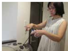
家での隙間時間は手術トレーニング