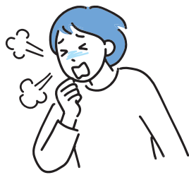
基礎疾患を有する方