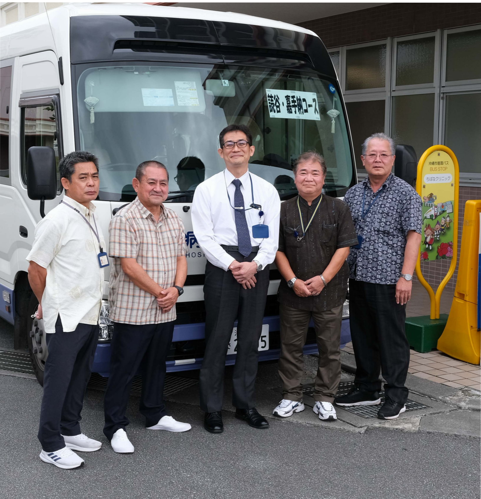
ちばなクリニック管理課事務部長と無料巡回バス運転手のみなさん