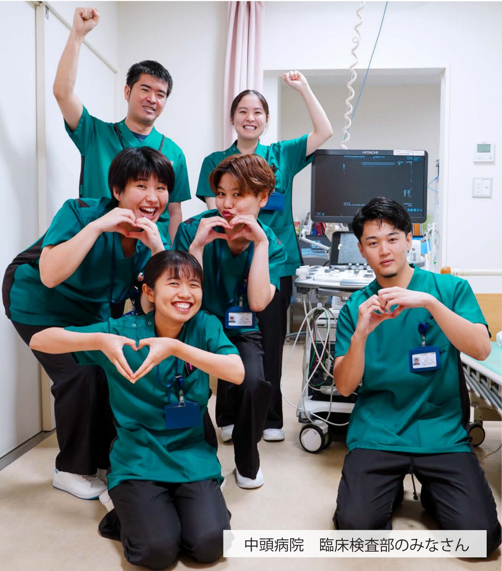
中頭病院 臨床検査部のみなさん