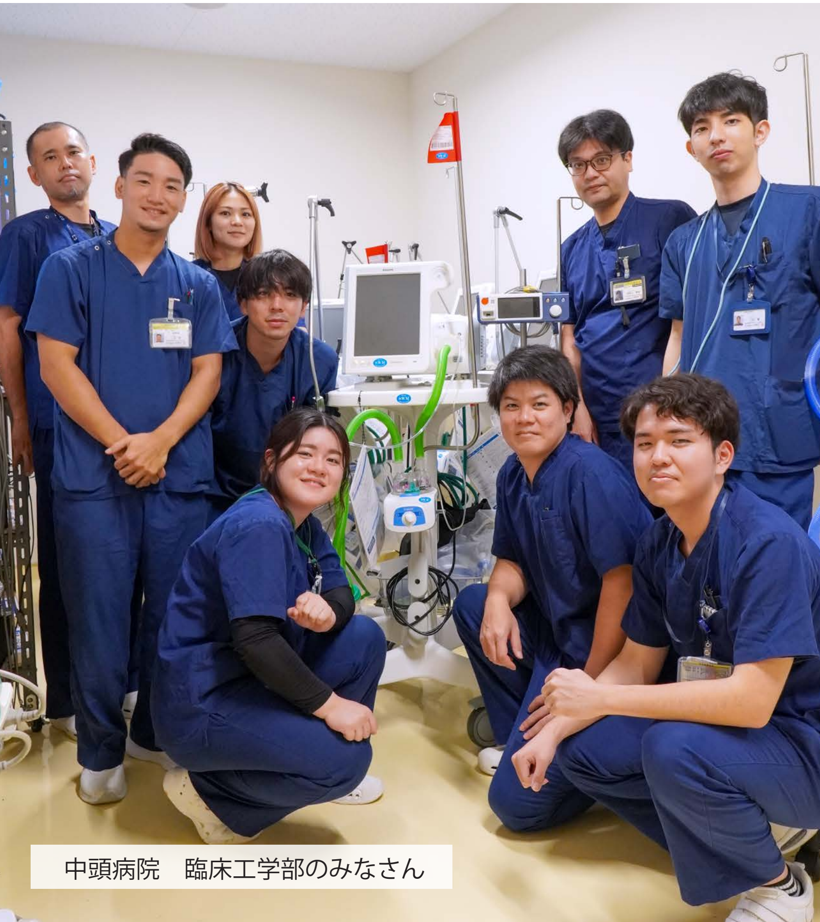
中頭病院 臨床工学部のみなさん