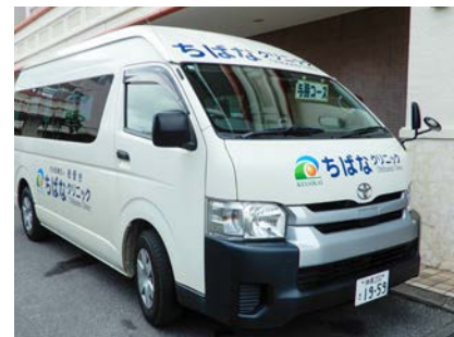
▲ 与勝コース巡回バス