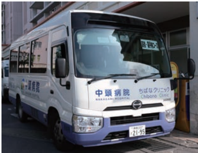
▲ 読谷コース巡回バス

敬愛会では、うるま市与勝・読谷村の2路線へ無料の巡回バスを運行しています。 (平日6便、土曜4便 ※日・祝祭日除く) 通院患者さん、付添の方でしたらどなたでもご利用いただけます。ご乗車の際は運行表をご確認ください。また、中頭病院・ちばなクリニック間の無料シャトルバスも運行しております。併せてご利用ください。